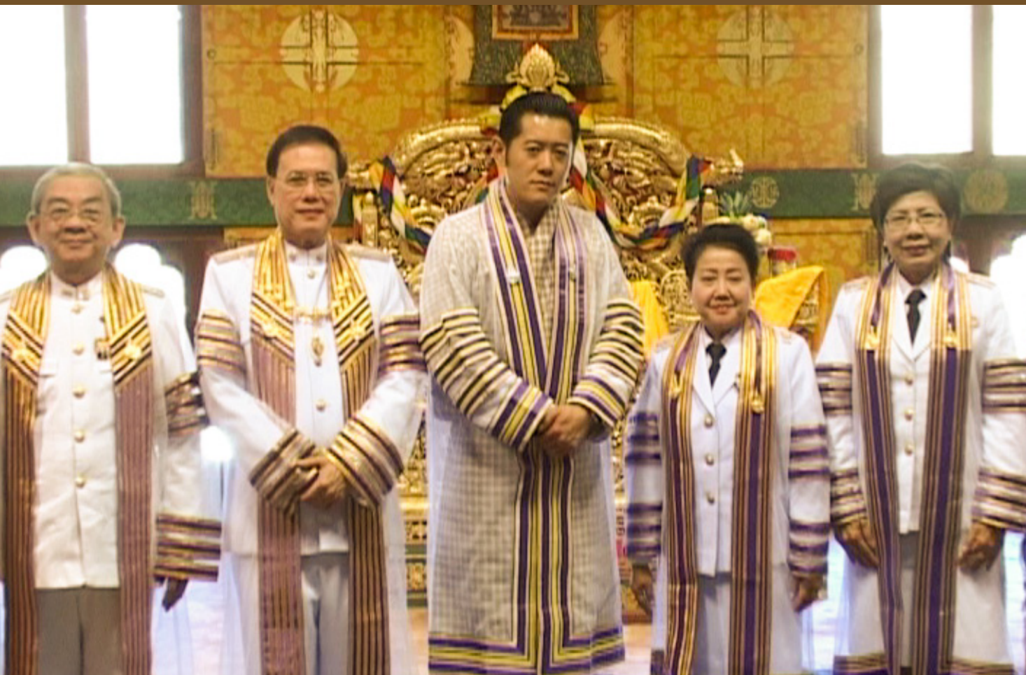
สมเด็จพระราชาธิบดี จิกมี เคเซอร์ นัมเกล วังชุก ทรงฉลองพระองค์ครุย วิทยฐานะ: ดุษฎีบัณฑิตกิตติมศักดิ์ ของมหาวิทยาลัยเทคโนโลยีราชมงคลพระนคร และทรงฉายพระรูปร่วมกับคณะผู้บริหารมหาวิทยาลัยเทคโนโลยีราชมงคลพระนคร