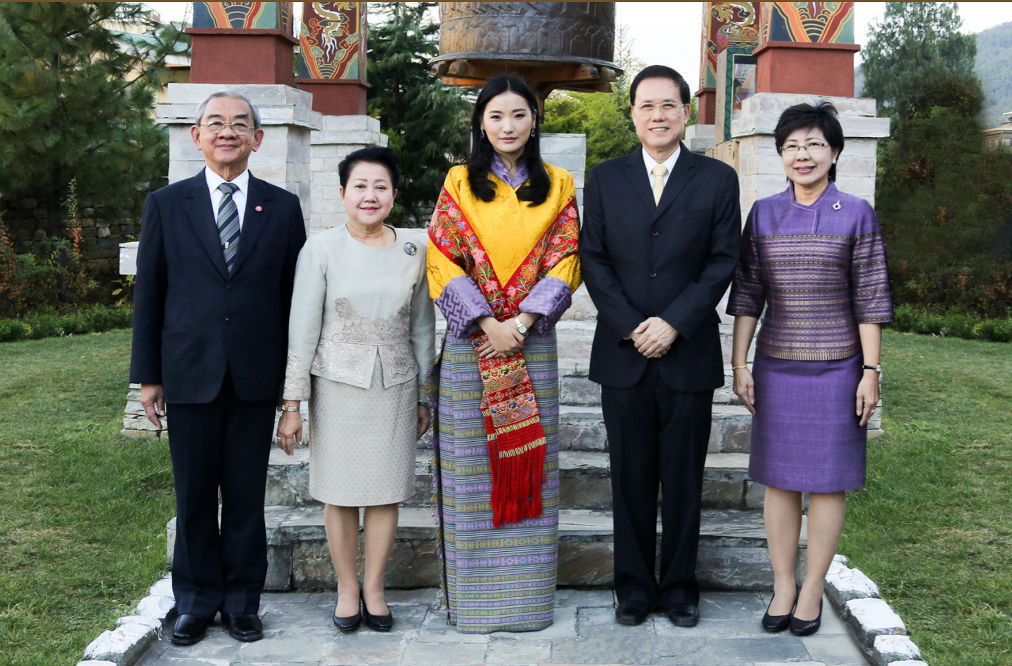
สมเด็จพระราชินีจัตซุน เพมา วังชุก แห่งราชอาณาจักรภูฏาน ทรงพระราชทานเสื้อยงม้าเขา ให้กับศาสตราจารย์เกษมศก เหมะธีระ และคณะผู้บริหารของมหาวิทยาลัยเทคโนโลยีราชมงคลพระนคร พร้อมด้วยพระธูปห่มู๋ ในวันพุธที่ ๑๓ พฤศจิกายน ๒๕๕๖ ณ โรงแรม Taj Tashi Thimphou